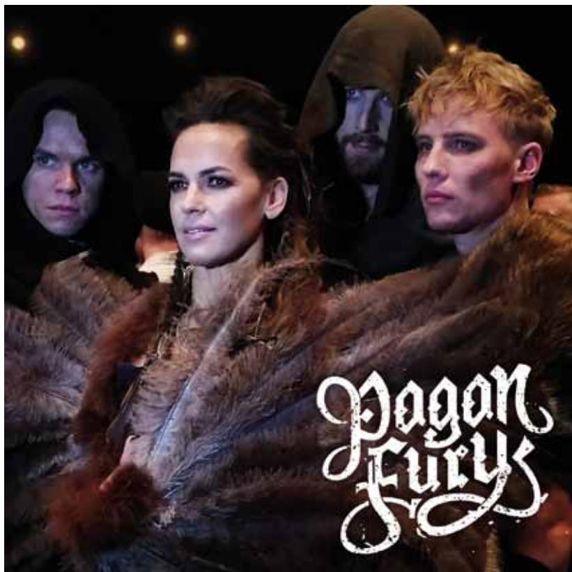
Paradox eget band Pagan Fury deltog i årets uttagning till Melodifestivalen med låten Stormbringer. Deras musik förekommer bl a i Paradoxspelet Crusader kings II.

Samtidigt kan man notera att Paradoxkursen nästan varje dag svänger kraftigt. En anledning är det stora intresset för datorspelsbolag som lockar till sig spekulanter och en amerikansk investmentbank har lanserat en "turbowarrant" med Paradox som underliggande aktie. Det är ett komplext instrument som gör att man med större hävstång kan spekulera i kursuppgångar på Paradoxaktien. Då Stockholmsbörsen tjänar pengar på alla transaktioner är de positiva till denna typ av instrument som gör börsen till ett kasino för kortsiktiga spekulanter. Notera också att ca 80 % av aktierna i Paradox ligger på "fasta händer" och det är de resterande 20 %-en som omsätts varje år. Sedan kan man fråga sig hur det faktiska värdet av Paradox har förändrats under året? Värdet på bolaget var inte 100 % mer i juni än i januari som var hur det dagliga priset förändrades. Om omsättningen under året ökat med 39 % och vinsten med 34 % kanske den faktiska uppgången under året på 28 % är en bra uppskattning på den verkliga värdeökningen på bolaget. Kanske hade det varit bättre om Paradox hade handlat en gång om året för då hade vi sluppit den manodepressiva aktiemarknaden. (När ni läser börslistor kan ni konstatera att skillnaden mellan lägsta och högsta kurs för bolag de senaste 12 månaderna ofta är 50 %. Det visar hur mycket aktiemarknaden svänger medan de verkliga värdena av bolagen kanske inte ändras alls.)